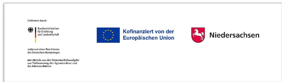
Abb. 6 Muster Logoanbringung Kombination BMEL - EU – Länderwappen (Beispiel Niedersachsen)

Zusätzlich zur Logokombination ist noch der Hinweis: „Mitfinanziert durch die Gemeinschaftsaufgabe „Verbesserung der Agrarstruktur und Küstenschutz (GAK)“ anzubringen. Für den Finanzierungshinweis kann folgender Text angebracht werden: