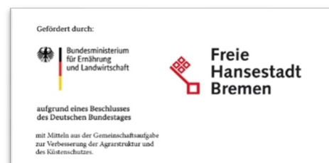
Abb. 7 Muster Logoanbringung BMEL - Länderwappen (Beispiel Bremen)

Hier investieren die Bundesrepublik Deutschland und die Freie Hansestadt Bremen in das Agrarinvestitionsförderungsprogramm.