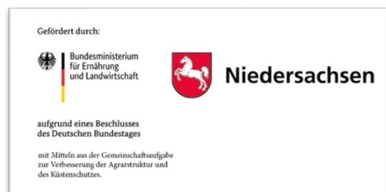
Abb. 7 BMEL Logo und Länderwappen (Beispiel Niedersachsen)

Zur Sichtbarkeit des BMEL- Logos gelten analog die Vorgaben wie unter 4.1